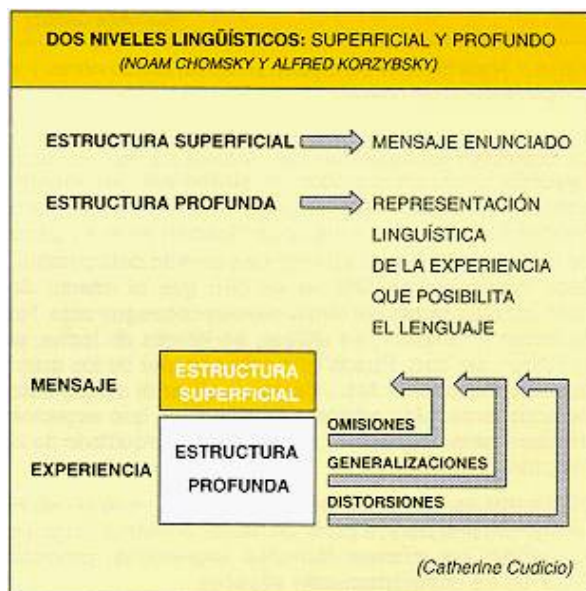
Fig. 4: El "metamodelo lingüístico"

Lo importante estriba no en que «hablemos de una manera u otra», sino en que esta forma determina un lenguaje «profundo» que es la «realidad» del comunicante, la forma particular de interpretar el mundo y comunicarlo a los demás. (Véase figura 4)